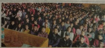
संजौली कॉलेज में नया सत्र शुरू होने से पूर्व नए छात्रों के लिए आयोजित परिचय वर्ष में भाग लेने छात्र-छात्राएं व अध्यापकगण।

रहने की अपील की और पढ़ाई, खेलकूद व सांस्कृतिक गतिविधियों में बढ़-चढ़कर भाग लेने की अपील की।