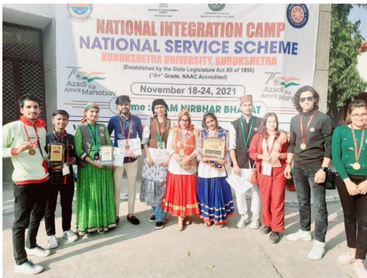
Image: NSS Volunteers securing Ist position in essay writing and IIIrd in skit under the theme Atm Nirbhar Bharat, while representing, COE, GDC Sanjauli at Kurukshetra University, Kurukshetra